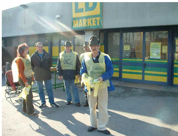
29 NOVEMBRE 2003 COLLETTA ALIMENTARE

Un grazie a tutti gli Alpini che hanno risposto all'invito del Banco Alimentare. Come sempre i nostri cappelli danno fiducia alla gente.