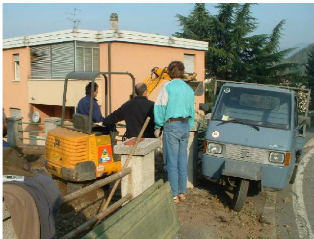
LAVORI IN CORSO AL MONUMENTO DI TRECALLO