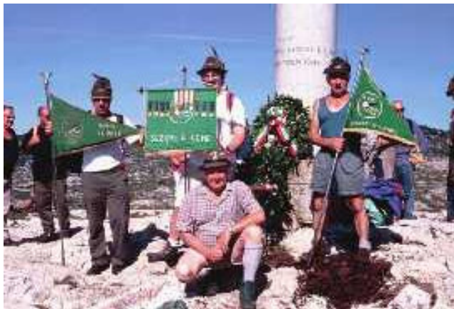
IL NOSTRO GAGLIARDETTO ALLA COLONNA MOZZA

Non avendo la possibilità di essere presenti alla manifestazione Nazionale sull' Ortigara, un nostro amico alpino si è offerto di portare il nostro Gagliardetto alla manifestazione. Proposta alla quale abbiamo aderito con molto piacere. Domenica 13 luglio eravamo quindi rappresentati sull' Ortigara, quella montagna che gli Alpini considerano sacra. Essa ricorda i durissimi combattimenti della Grande Guerra e le decine di migliaia di Caduti, dall'una e dall'altra parte. Ancor oggi l'altopiano mostra evidenti i segni della guerra: è un terreno senza alberi, cosparso di buche delle granate che sconvolsero ogni cosa. Lungo il sentiero che porta alla vetta sono ancora presenti molti ruderi, vecchi posti avanzati del comando e degli alloggiamenti austriaci. Alla Colonna Mozza, dopo la deposizione di una corona alla presenza del Labaro nazionale, è stata celebrata una S. Messa in suffragio dei Caduti. Un' altra corona è stata deposta per ricordare i Caduti austriaci, che erano rappresentati da una Associazione d'Oltralpe.